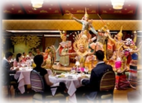
【サラリムナム:タイ舞踊ディナーショー】