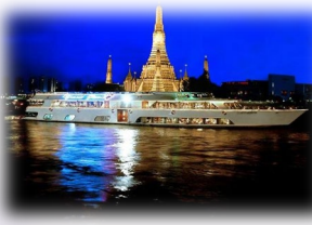
【グランドパール号:船上ディナーと夜景クルーズ】